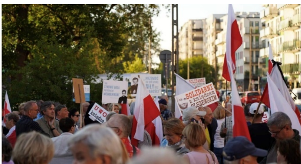
Protest w obronie ks. Olszewskiego