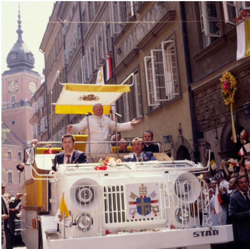
Warszawa wita Papieża

Żegnając ojczystą ziemię rzekł: Żegnam Polskę, żegnam swoją ojczyznę. Tu się głos jego załamuje. Papież klęka na ziemi, całuje ją. „ Niech was błogostawi Bóg Wszechmogący, Ojciec i Syn i Duch Święty. Wszyscy płaczą, on też.