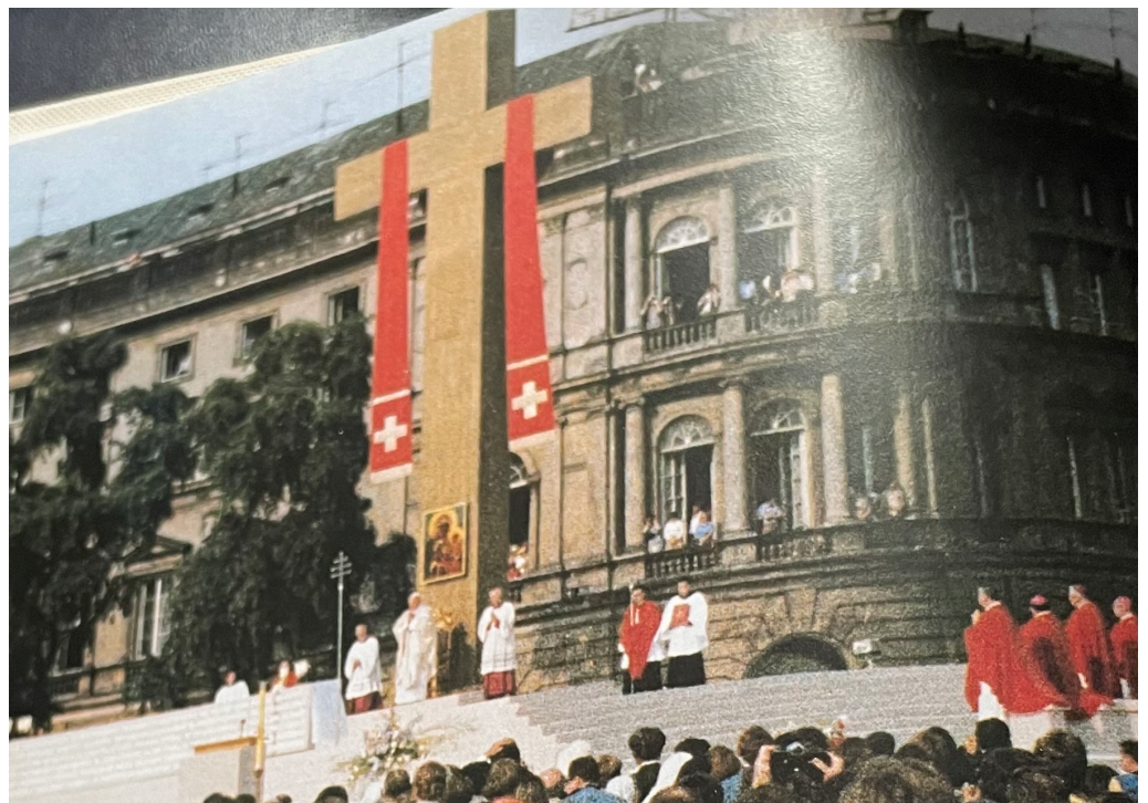
Warszawa, Plac Zwycięstwa