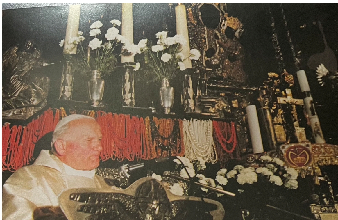
U stóp Panny Jasnogórskiej