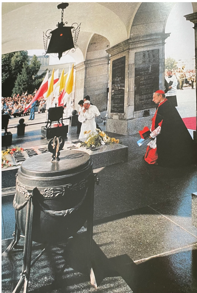
W hołdzie żołnierzom poległym za ojczyznę