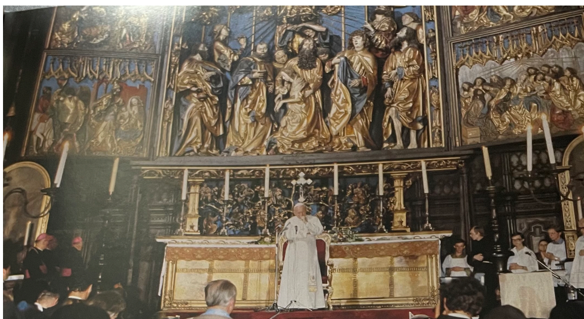
W kościele Mariackim, gdzie niegdyś spowiadał